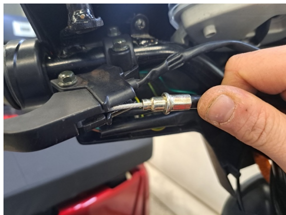
Ota vaijeri pois jarruvivun juuresta.