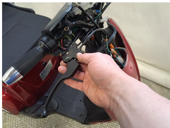
Ota vasen jarrukahva pois.

Uuden osan asennus käänteisessä järjestyksessä.